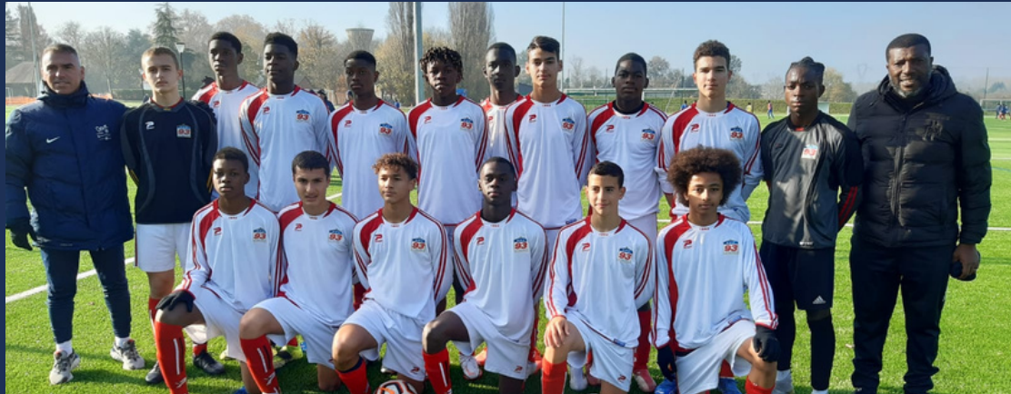
SÉLECTION 93 INTERDISTRICT U15 PAGE 5